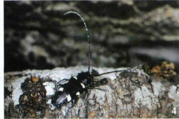
Abb. 1 – Landschaft im Bereich der Nsere Lodge zu Beginn der Regenzeit. Abb. 2 – Baumsavanne mit Akazien und Kandelaberwolfsmilch. Abb. 3 – Tragocephala nobilis (FABRICIUS), ♀, 16 mm. Abb. 4 – Zographus nitidus ssp. typ. (AURIVILLIUS), ♂, 18 mm.