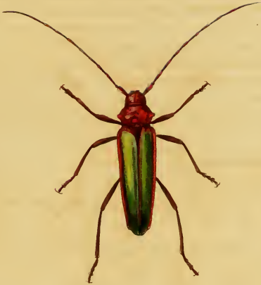
Crioprosopus viridipennis, Dej