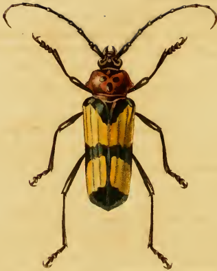
Crioprosopus Servillei, Dupont.