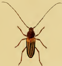
Trachyderes Olivieri, Dupont.