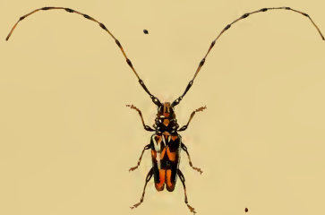
Trachyderes signatus , Wiedemann