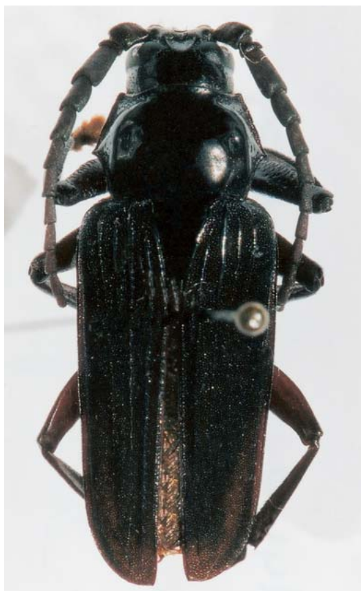
Fig. 3. Habitus, Poekilosoma carinatipene Lane, 1941, ♂, de Linhares, Espírito Santo, Brasil, comprimento total, 23,3 mm.

♂. Tegumento castanho-escuro a preto, brilhante. Pontuação fina e esparsa na região dorsal da cabeça, nos lados do pronoto, nos esternos torácicos, nas pernas médias e posteriores e nos urosternitos. Epístoma densamente pontuado. Pernas anteriores com