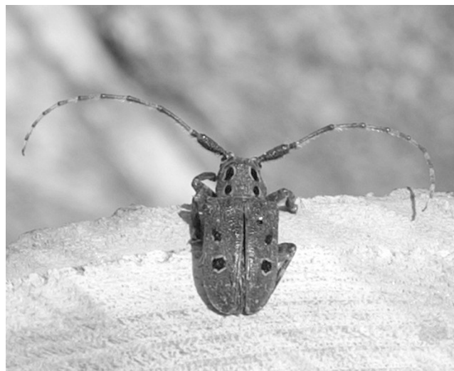
Fig. 2 - Mesosa curculionoides.

Alcuni accorgimenti operativi da considerare al momento degli interventi selvicolturali potrebbero di conseguenza rappresentare un valido contributo alla salvaguardia degli aspetti ecologico-funzionali del bosco, in maniera