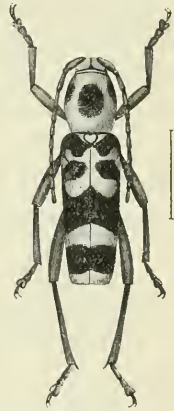
Fig. 3. Clytus Fristedti AURIV.

Diese Art ist mit X. australis LAP. & GOR. nahe verwandt. LAPORTE und GORY geben an, dass ihre Art aus Neu Guinea stamme und beschreiben den Halsschild einfach als »cendré sur les cotés» und das ganze Thier als »cinereo-niger», was weder auf das Weib noch den Mann passt. Wer zuerst australis aus Queensland angeführt hat, weiss ich nicht, wahrscheinlich hat er jedoch die hier beschriebene Form vor sich gehabt. X. Phidias