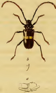
Charinotes fasciatus, Dupont