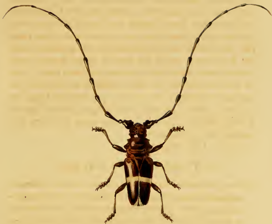
Trachyderes Reichii, Dupont