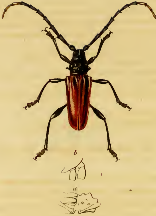
Desmoderus variabilis Dupont