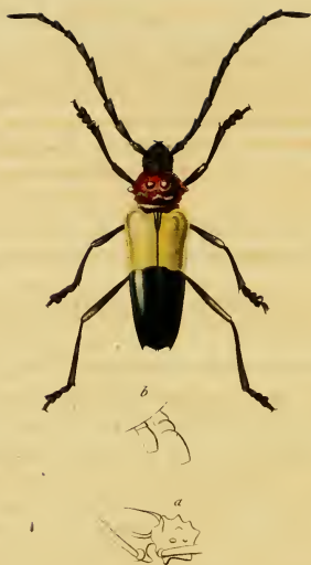
Phœdinus tricolor , Dupont.