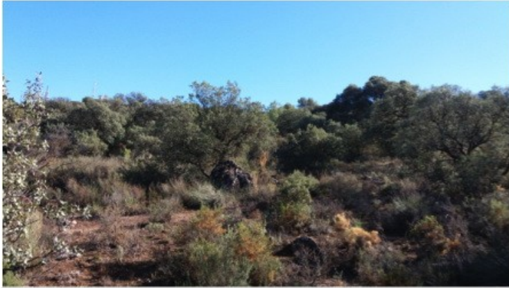
Fig. 2. Biotopo de sierra Elvira, Granada donde se localizó a Trichoferus magnanii Sama, 1992