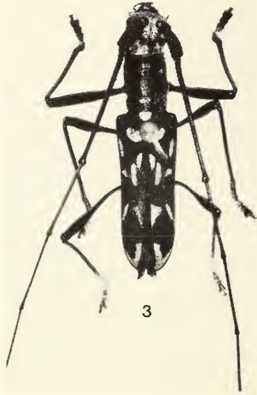
Abb. 3: Cylindrepomus ysmaeli spec. nov., Holotypus ♂.

Antennen reichlich dreimal so lang wie der Körper; Schaft relativ schlank, 2\frac{1}{2} mal so lang wie breit, grob und gedrängt gekörnt, 3 die Mitte der Elytren überragend, nicht ganz doppelt so lang wie 4; 4 – 10 gleich lang, 11 um die Hälfte länger; 3 basal fein und dicht, zur Spitze weitläufig gekörnt, 4 – 10 an der Innenseite äußerst fein und zerstreut.