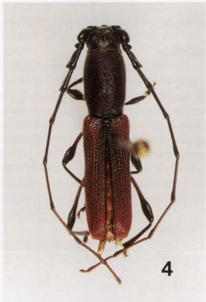
Figs 1-4. (1) Ancylocera sergioi sp. n., holótipo fêmea; (2) A. spinola sp. n., holótipo fêmea; (3) A. bruchi , macho; (4) A. nigella , macho.