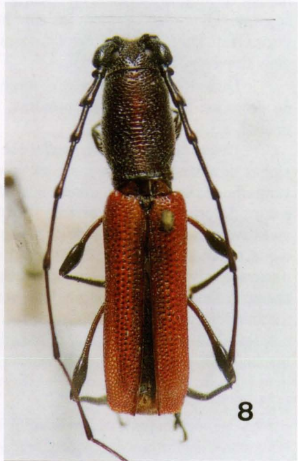
Figs 5-8. (5) Ancylocera bicolor , macho; (6) A. michelbacheri , holótipo macho; (7) A. amplicornis , holótipo macho; (8) A. sallei , macho.