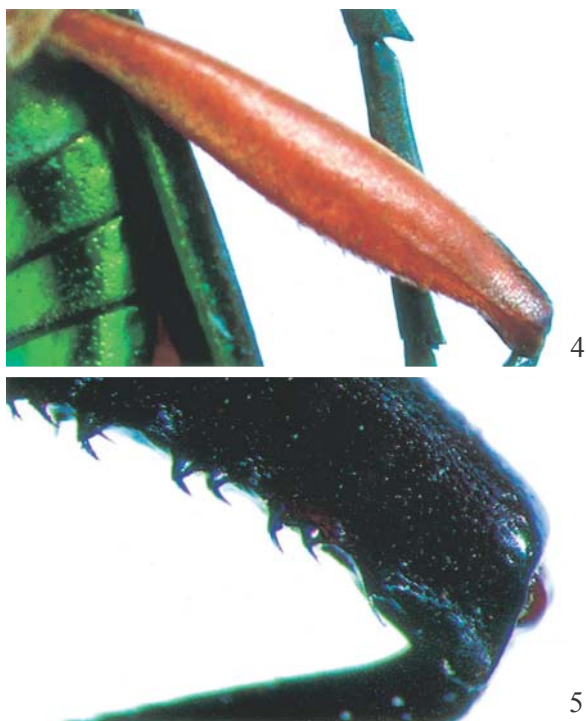
Figs. 4-5. 4, Xystochroma femoratum , detalhe do metafêmur; 5, X. echinatum , idem.

Zajciw (1958) arrolou X. equestriforme para o Rio de Janeiro (Corcovado) com base num macho, examinado, o que permitiu confirmar a sinonímia proposta.