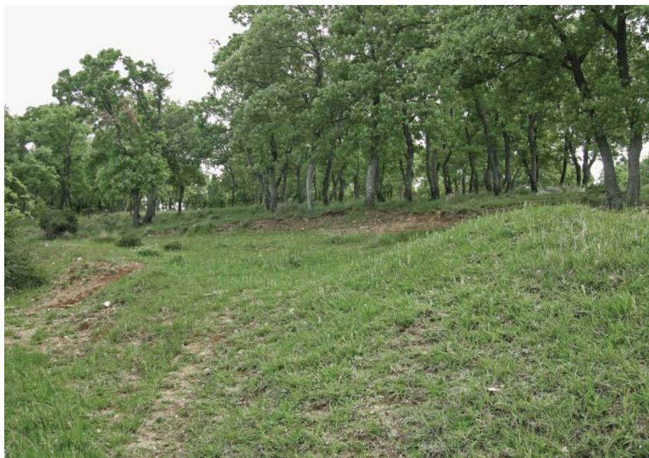
Fig. 10 - Habitat di (of) Dorcadion ariannae , presso (near) Petrohori, nom. Xanthi.

In un nostro recente contributo (Pesarini & Sabbadini, 2007: 62) avevamo messo in rilievo alcune differenze riscontrate fra il materiale da noi esaminato di D. tuleskovi Heyrovsky, 1937 e l'olotipo di D. olympicola Heyrovsky, 1941, avanzando peraltro riserve sull'effettiva distinzione, a livello specifico, dei due taxa, descritti entrambi del Monte Olimpo. L'esame di ulteriore materiale, pur se anch'esso non abbondante, ha evidenziato che le differenze riscontrate, anziché essere dovute ad