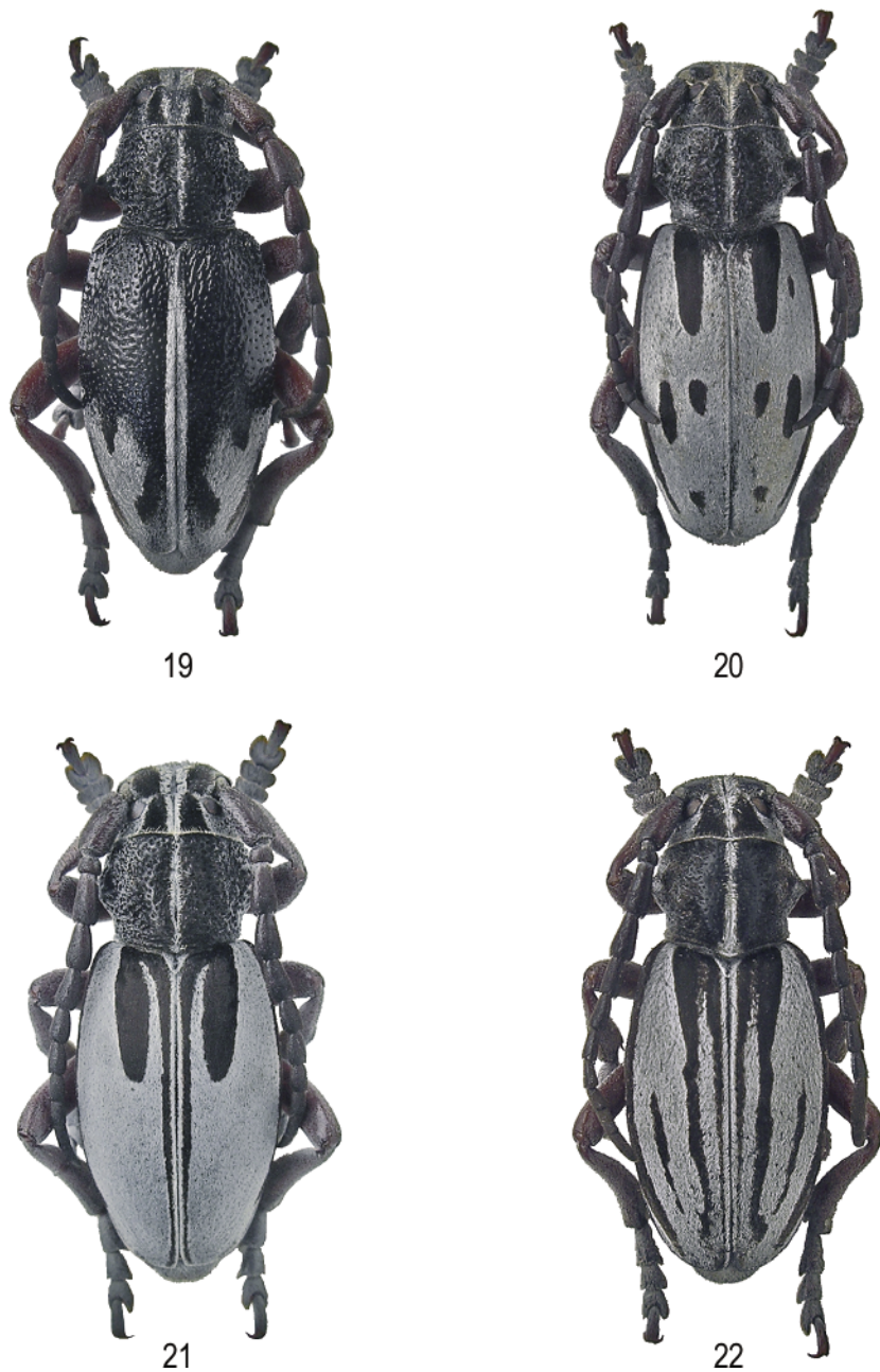
Figg. 19-22 – 19) D. purkynei Heyrovsky, 1925 ♂, Oros Kaimaktsalan 2.170 m, Grecia (Greece), nom. Florina. 20) D. kaimakcalanum Jureček, 1929 ♂, Oros Kaimaktsalan 1.800 m, Grecia (Greece), nom. Florina. 21) D. obenbergeri Heyrovsky, 1940, ♂, Oros Vermio 1.600 m, Grecia (Greece), nom. Imathia. 22) Dorcadion meschniggi Breit, 1929, ♂, Oros Olympos 2.200 m, Grecia (Greece), nom. Pieria.