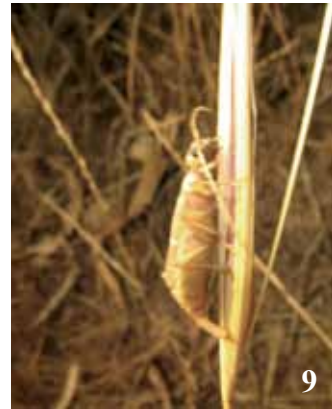
Figg. 6-9 – Infiorescenza di timo (6). Femmina in ovideposizione su Hyparrhenia (7). Foro dell'ovopositore su spighetta di Hyparrhenia (8). Femmina in ovideposizione su Hyparrhenia (9).

sono stati osservati nelle ragnatele di Argiope lobata (Pallas, 1772) (Araneae, Araneidae). È possibile che una volta deposto e terminato lo “sforzo riproduttivo” le femmine siano più vulnerabili, specialmente quando iniziano ad agonizzare. Da segnalare inoltre anche la presenza nel sito di indagine di una numerosa popolazione di Allocosa oculata (Simon, 1876) (Araneae, Lycosidae) attivo predatore della specie secondo le mie osservazioni.