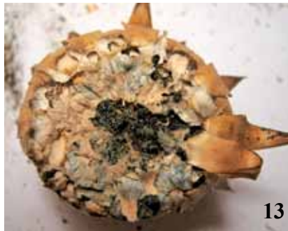
Figg. 10-13 – Uova su spighetta di Hyparrhenia (10). Femmina gravida vagante al suolo (11). Erosioni larvali su capolino di Onopordon (12-13).

cie di Vesperus , ed in particolare su alcune che manifestino un diverso grado di brachitterismo, possano portare alla luce nuove osservazioni (forse utili anche in chiave filogenetica), circa i rapporti tra grado di brachitterismo ed eco-etologia riproduttive.