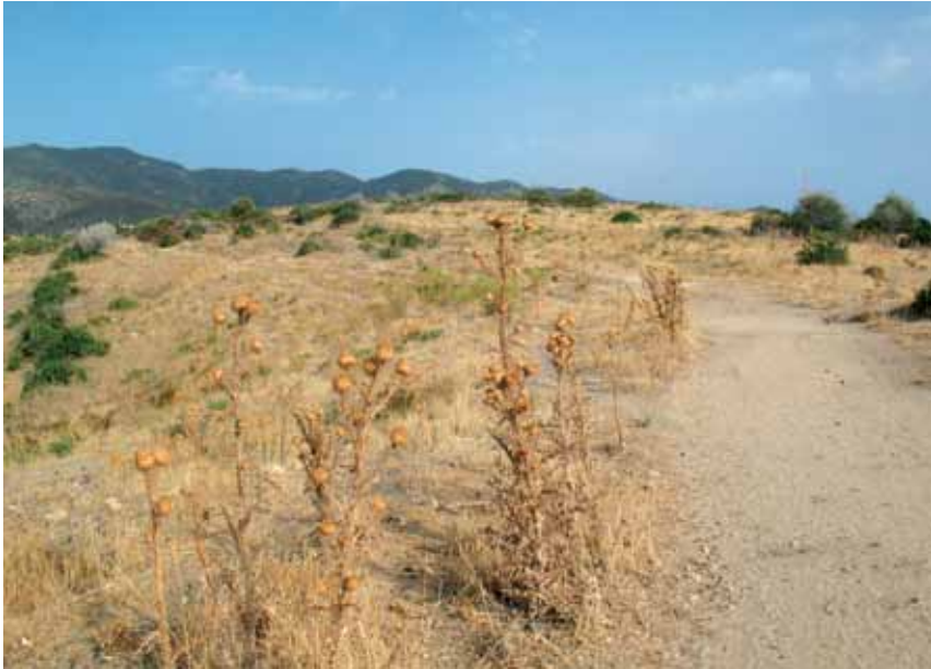
Fig. 1 – Sito di indagine.

serate ventose, probabilmente perché i maschi sono disturbati nell'individuare le femmine che pertanto non escono nemmeno dai loro rifugi nel terreno.