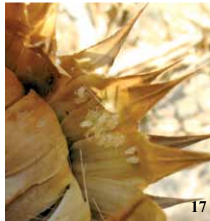
Figg. 14-17 – Erosioni larvali su fusto di Onopordon (14-15). Sviluppo elitra e ala membranosa in Vesperus macropterus femmina (16). Larve di I a età su Onopordon (17).

ridae tre sottofamiglie: Philinae (regione sud est Asiatica e Africana), Anoplodermatinae (regione Neotropica) e Vesperinae (regione Mediterranea). Tralasciando le discussioni sistematiche sulla posizione delle sottofamiglie dei Vesperidae o sulle teorie che considerano i Vesperinae come famiglia a sé o come sottofamiglia di Cerambycidae, estranee alle finalità del presente lavoro, non si possono non notare alcune interessanti similitudini tra Philus antennatus e Vesperus macropterus .