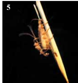
Figg. 2-5 – Capolini di Onopordon nel periodo di osservazione (2). Femmina in deposizione su capolino di Onopordon (3). Uova su capolino di Onopordon (4). Copula su Hyparhenia (5).

non si è in effetti mai riscontrato alcun volo attivo in nessuna di queste; si è però assistito ad un comportamento davvero interessante: una femmina, disturbata sul capolino di un Onopordon a circa 1 m di altezza dal suolo, ha aperto prima le elitre e poi le ali membranose per poi lasciarsi cadere al suolo utilizzando le ali per attutire la caduta.